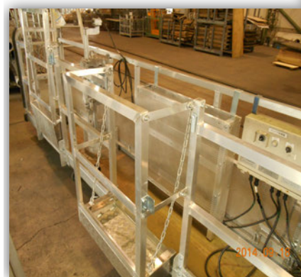
《ゴンドラハネ出しステージ》