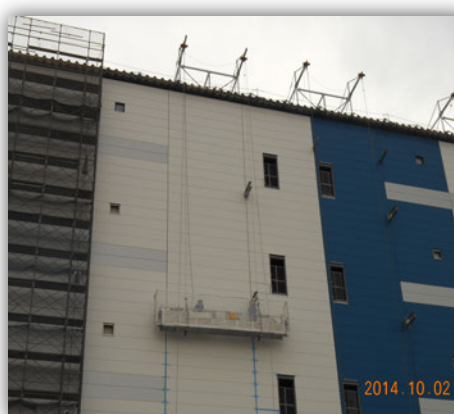
⑦【ゴンドラにてシール作業】