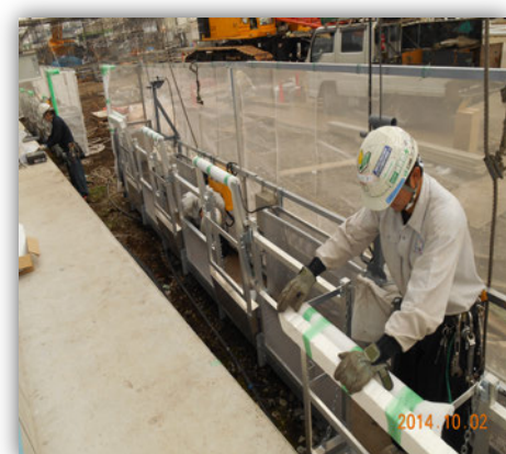
⑧【ステージ付き特殊ゴンドラ】