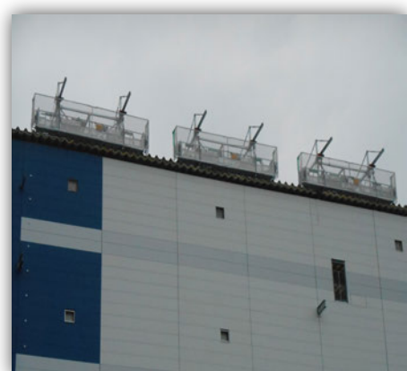
⑥【ゴンドラ設置後外観】