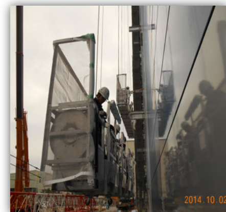
⑨【ハネ出しステージ格納時】