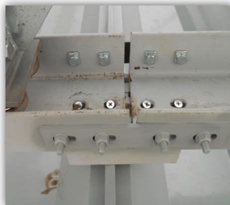
③【屋上走行レール 連結部】