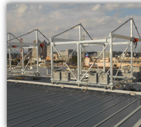
⑤【屋上吊元 カウンターウエイト式】