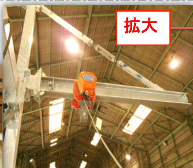
《ゴンドラ伸縮トロー》