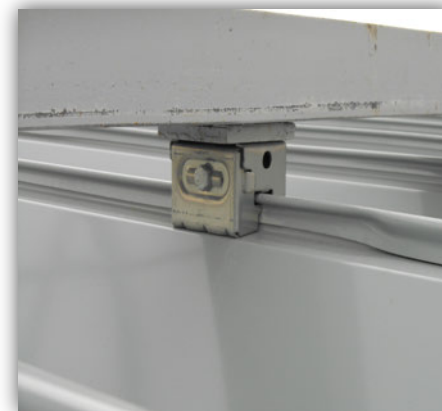
④【屋上走行レール 固定部】