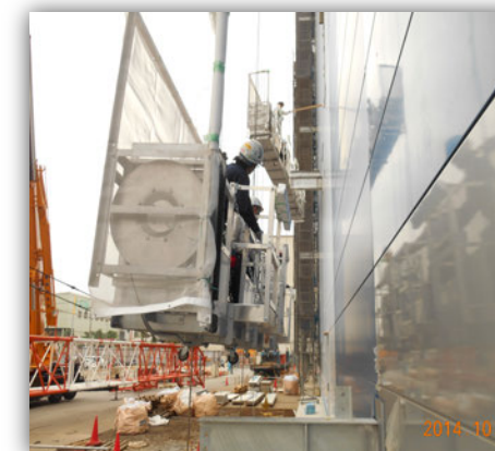
⑩【ハネ出しステージ使用時】