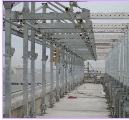
3 【屋上 吊元装置】