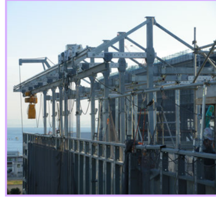
2 【屋上揚重機 横行レール】