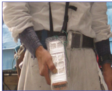
《無線操作装置・許容50m》