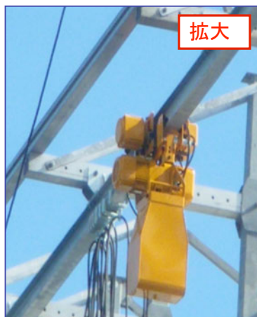
《ゴンドラ+揚重機横行レール》