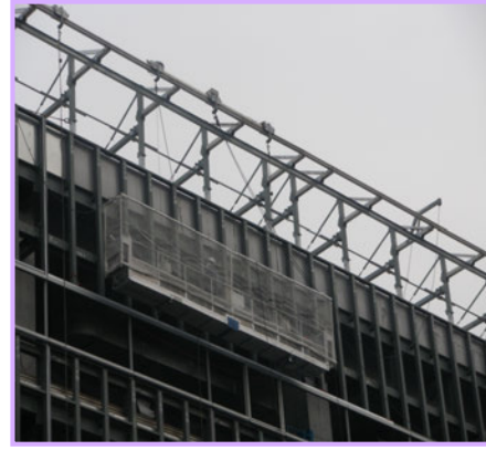
4 【ゴンドラ吊込 横行レール】