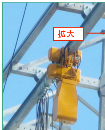
《ゴンドラ+揚重機横行レール》