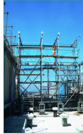
3 【屋上 揚重機 架台】