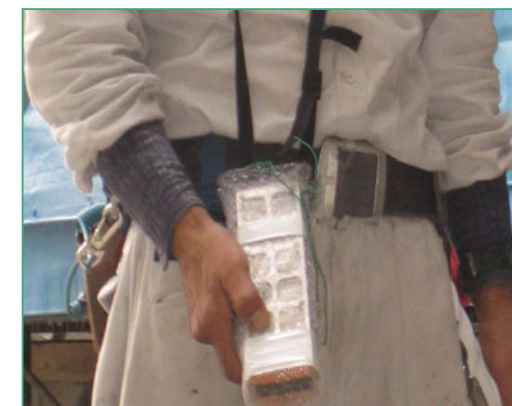
《無線操作装置・許容50m》