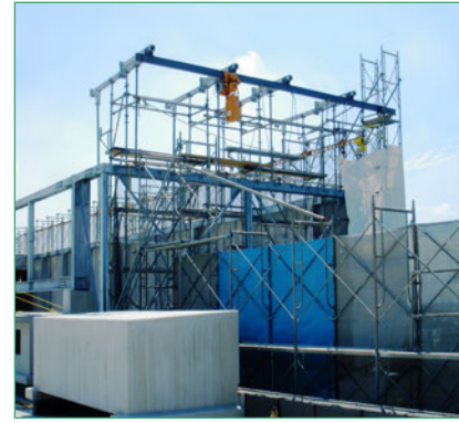
2 【屋上 揚重機 架台】