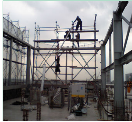
1 【屋上 架台組立】